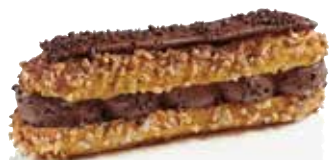
CHOCOLAT NOIR 62%