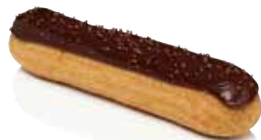
CHOCOLAT NOIR 62%