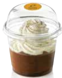
BABA DE MON PAPA

Immersion ambrée d'un baba au rhum et sa pointe de vanille.